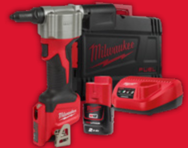
M12 PCSS-2012C | ART.# 4933479242

M12 RAPTOR™ REZAČKA POTRUBIA Z NEHRDZAVEJÚCEJ OCELE