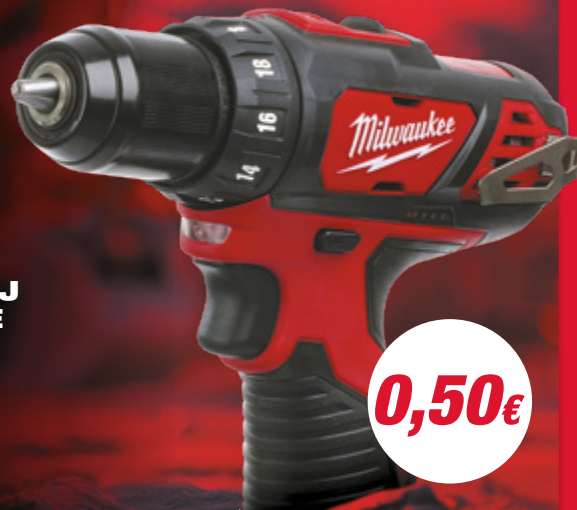
M12 BDD-0 | ART.# 4933441930

ZÍSKAJTE VRTACÍ SKRUTKOVÁČ ZA 0,50 € BEZ DPH!