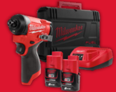
M12 FPTR-202X | ART.# 4933499411

M12 FUEL SUBKOMPAKTNÝ 1/4" RÁZOVÝ UTAHOVÁK