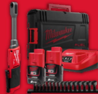
M12 BPRT-201X | ART.# 4933464405