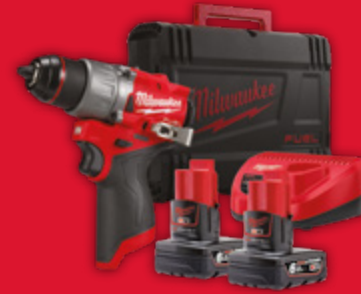
M12 FID2-202X | ART.# 4933479877

M12 FUEL SUBKOMPAKTNÁ PRÍKLEPOVÁ VRTAČKA