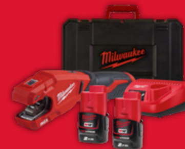
M12 3PLKIT-401P | ART.# 4933478960

M12 RAPTOR™ REZAČKA POTRUBIA Z NEHRDZAVEJÚCEJ OCELE